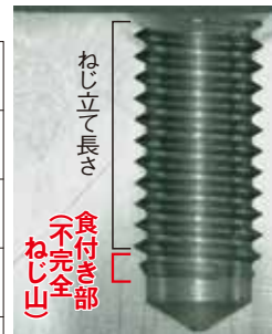
VUSP 1.5P めねじ断面