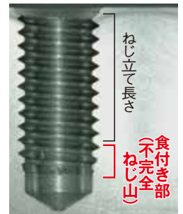
VUSP(食付き2.5P) めねじ断面